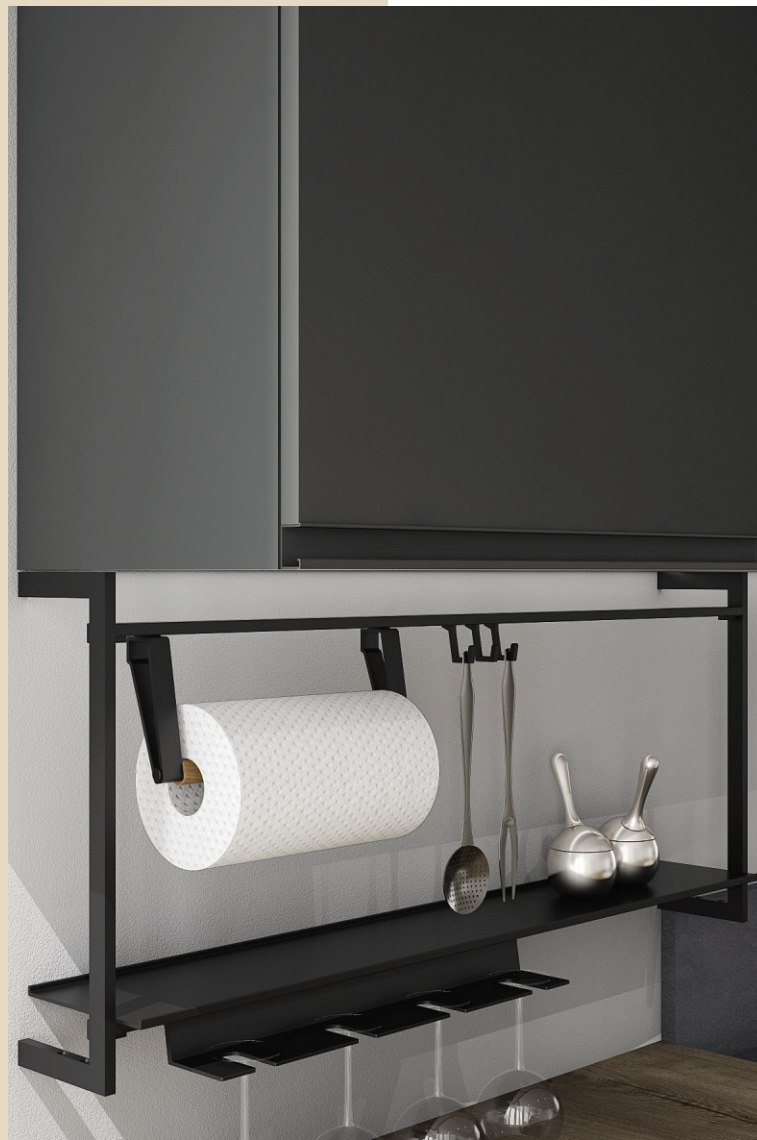
CORP SUSPENDAT INFERIOR SI MANER