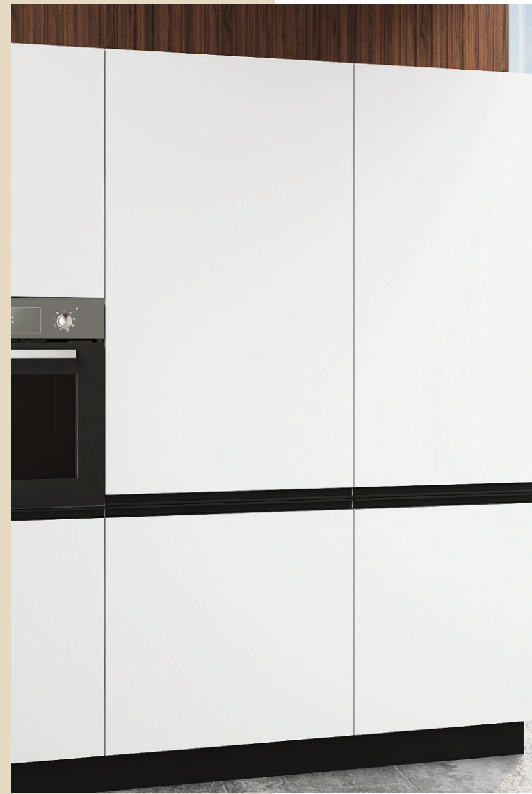
Coloana de 75 cm