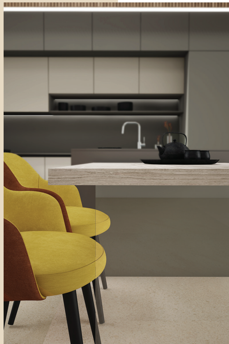
PICIOR PENINSULĂ DIN STICLĂ