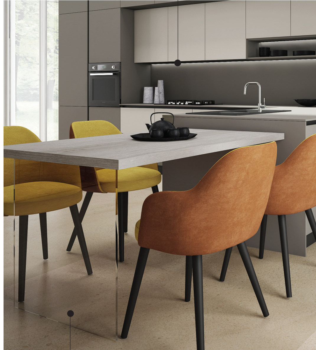
Picior din sticla